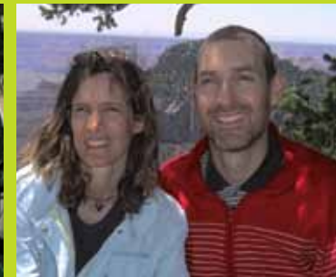
mit Burgers und Team