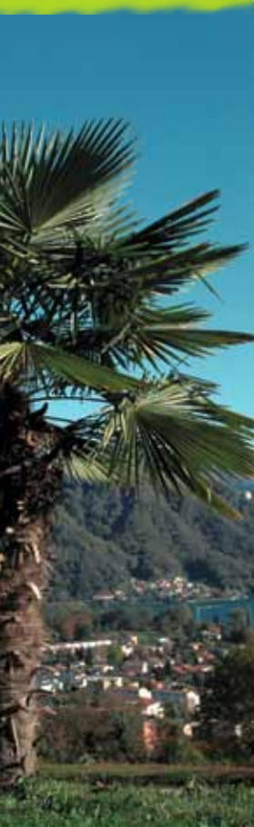
Zeit haben ...

Vitalkost • Fachvorträge «Gesundheit» • mutmachende Impulse • Erholung