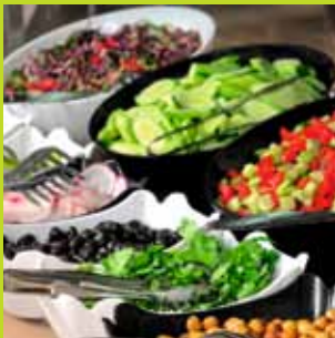
natürlich genießen ...